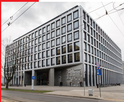
Greenday, Wrocław 7.000 m 2