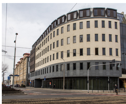
Urząd Miejski Wrocław 3.500 m 2