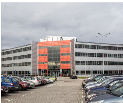
Volvo Polska 7.000 m 2