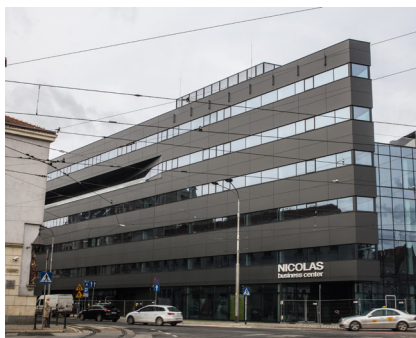
Nicolas Business Center 18.000 m 2