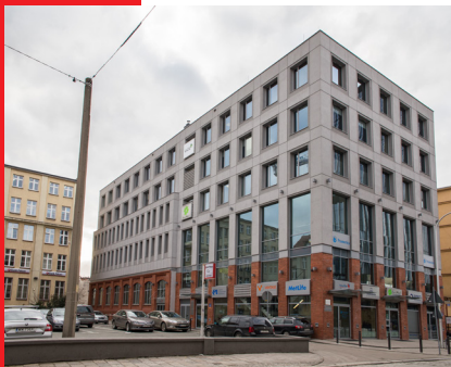
Delta 44, Wrocław 800 m 2