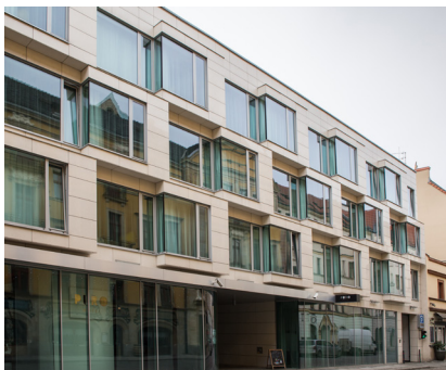
Hoel Puro, Wrocław 4.000 m 2