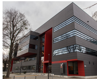
Technopolis, Wrocław 800 m 2