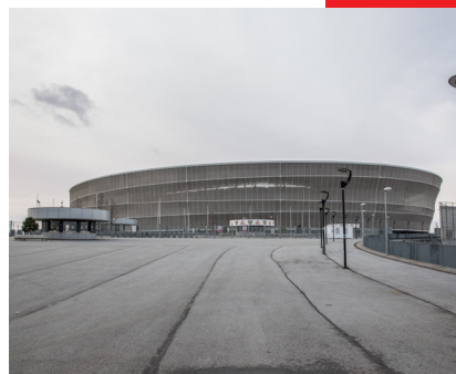
Stadion Wrocław 10.000 m 2