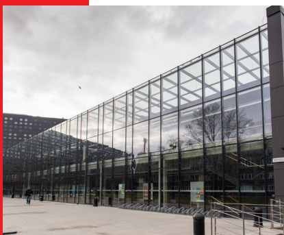
Politechnika Wrocławska budynek C7 prace wykończeniowe