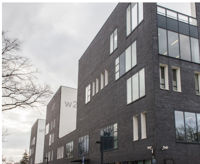
Geocentrum, Wrocław 6 000 m 2