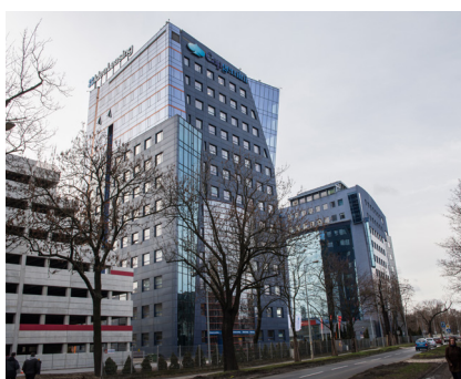
Capgemini Software Solutions Center 7.000 m 2