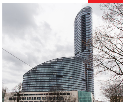
Sky Tower Wrocław 600 m 2