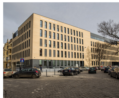
Biblioteka Muzeum Przyrodniczego Uniwersytetu Wrocławskiego 9.000 m 2