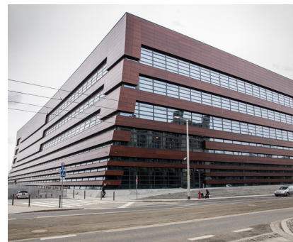
Narodowe Forum Muzyki 35689 m 2